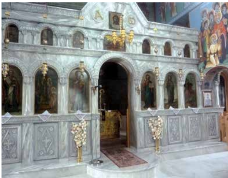
Το τέμπλο του νέου ναού