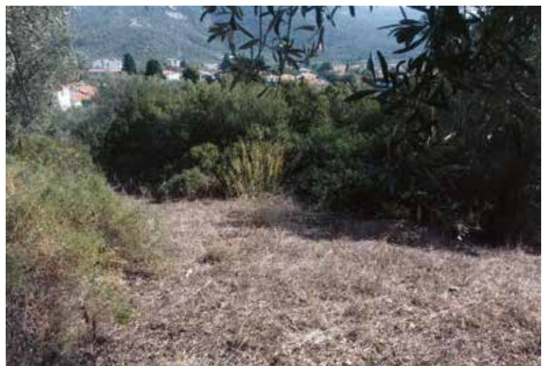
Κάπου εδώ πρέπει να βρισκόταν η παμπάλαια μονή του «Σταυρού»