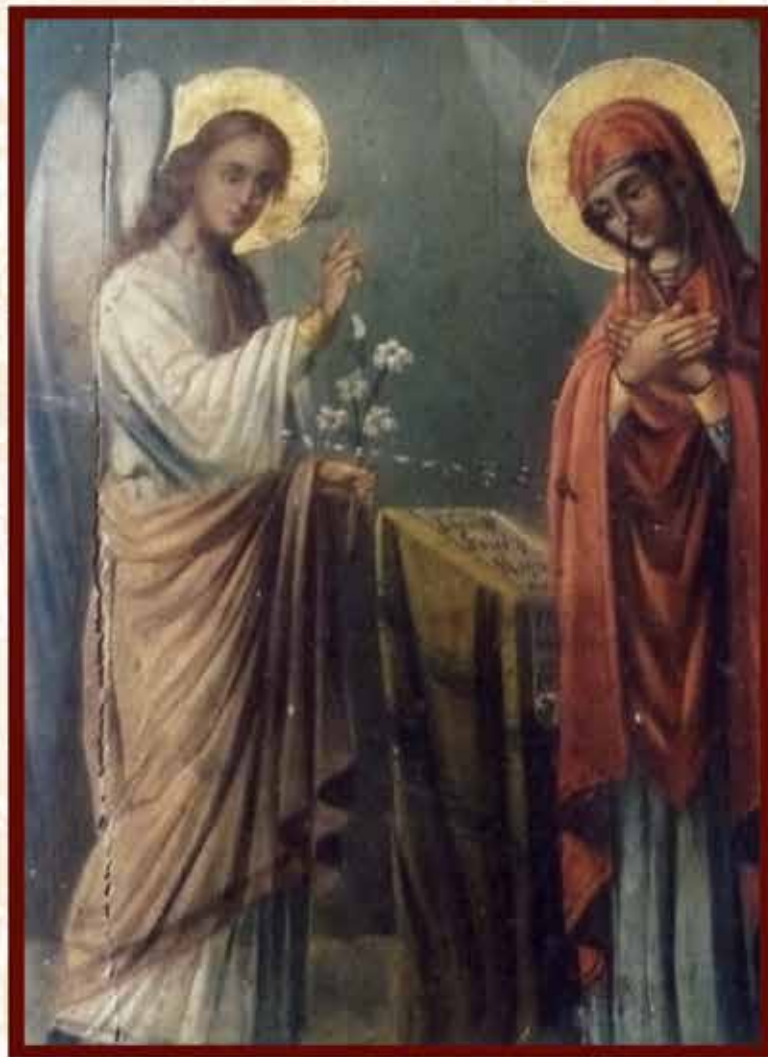
Ο ΕΓΑΓΓΕΛΙΣΜΟΣ ΤΗΣ ΘΕΟΤΟΚΟΥ (φορητή εικόνα)