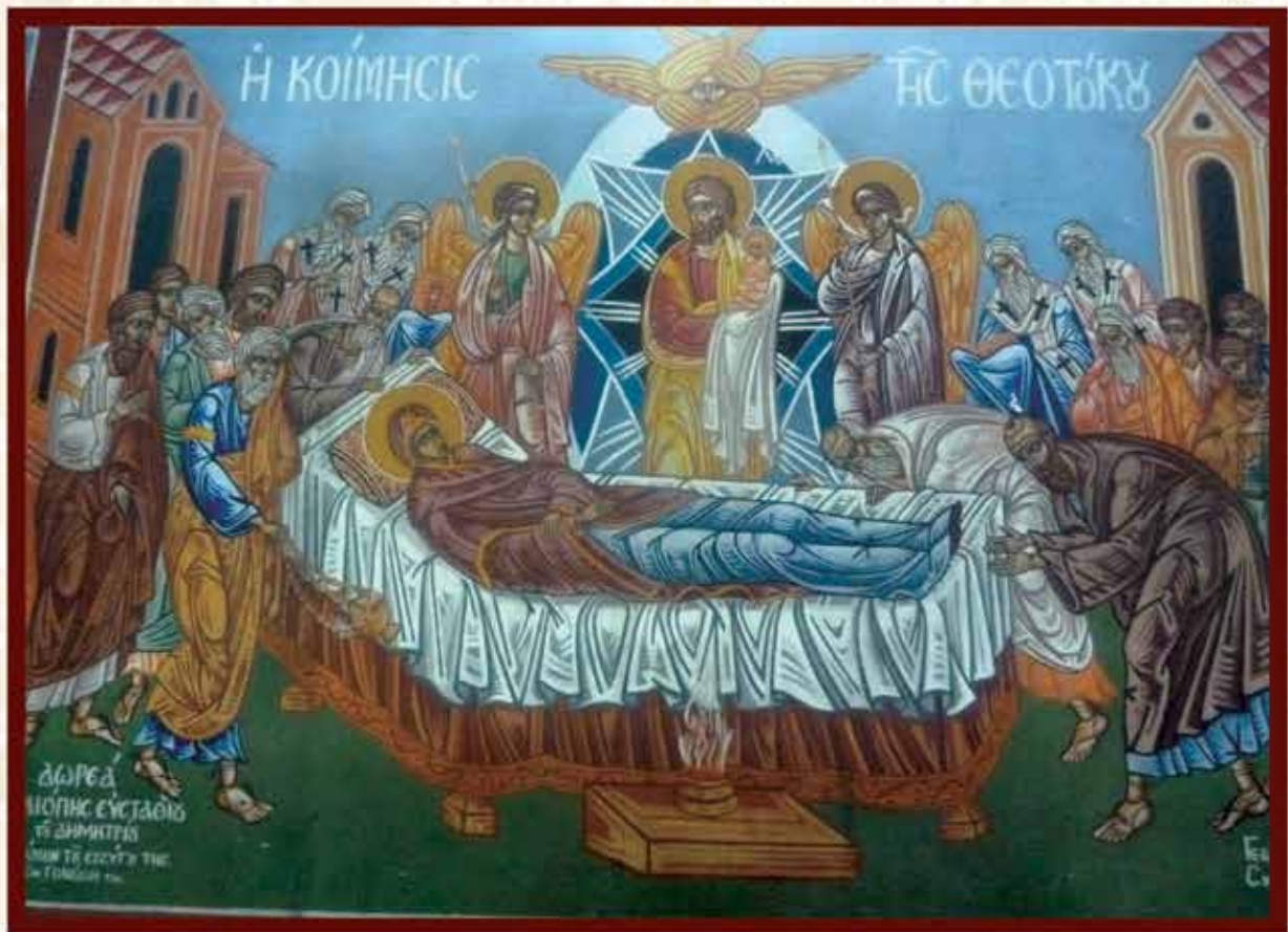
Η ΚΟΙΜΗΣΙΣ ΤΗΣ ΘΕΟΤΟΚΟΥ (Γ. και Ι. Σκοτεινιώτη)