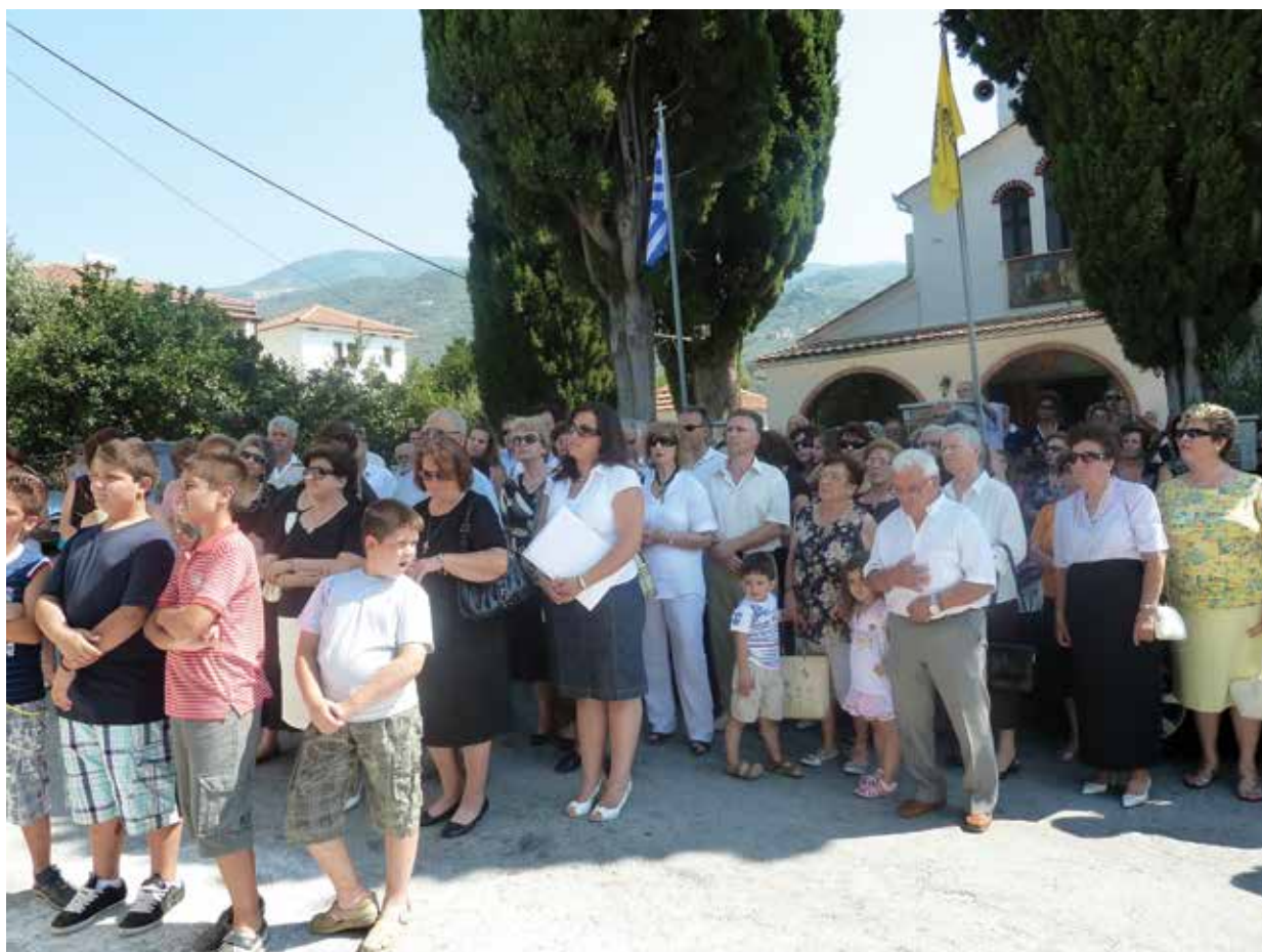
Πλήθος πιστών παρακολουθώντας την τελετή των εγκαινίων του Ενοριακού Κέντρου.

θώς κι ένα πλήθος φιλέορτων απ' όλα τα γύρω χωριά αλλά και το Βόλο, που, τα τελευταία κυρίως χρόνια, κατακλύζει όχι μόνο το ναό αλλά και το προαύλιο και τον διπλανό ακόμα δημόσιο δρόμο. Παλιότερα μάλιστα και ως τη δεκαετία του 1970 υπήρχε το έθιμο να προσφέρεται στους πανηγυριστές από τους επιτρόπους του ναού η καθιερωμένη φάβα. Έθιμο που ατόνησε τα κατοπινά χρόνια, λόγω του μεγάλου πλήθους των πιστών που καθιστά αδύνατη την εφαρμογή του.