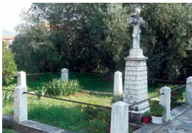
Ο οικογενειακός τάφος του Κωστή Κοντογεώργη