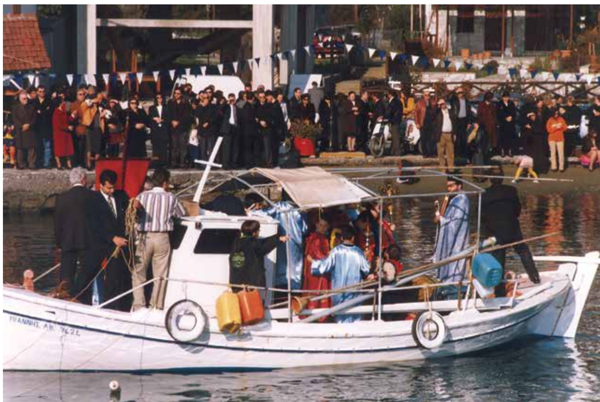
Η τελετή του Αγιασμού των Υδάτων στο Λιμανάκι της Κάτω Γατζέας τα Φώτα του 1999.