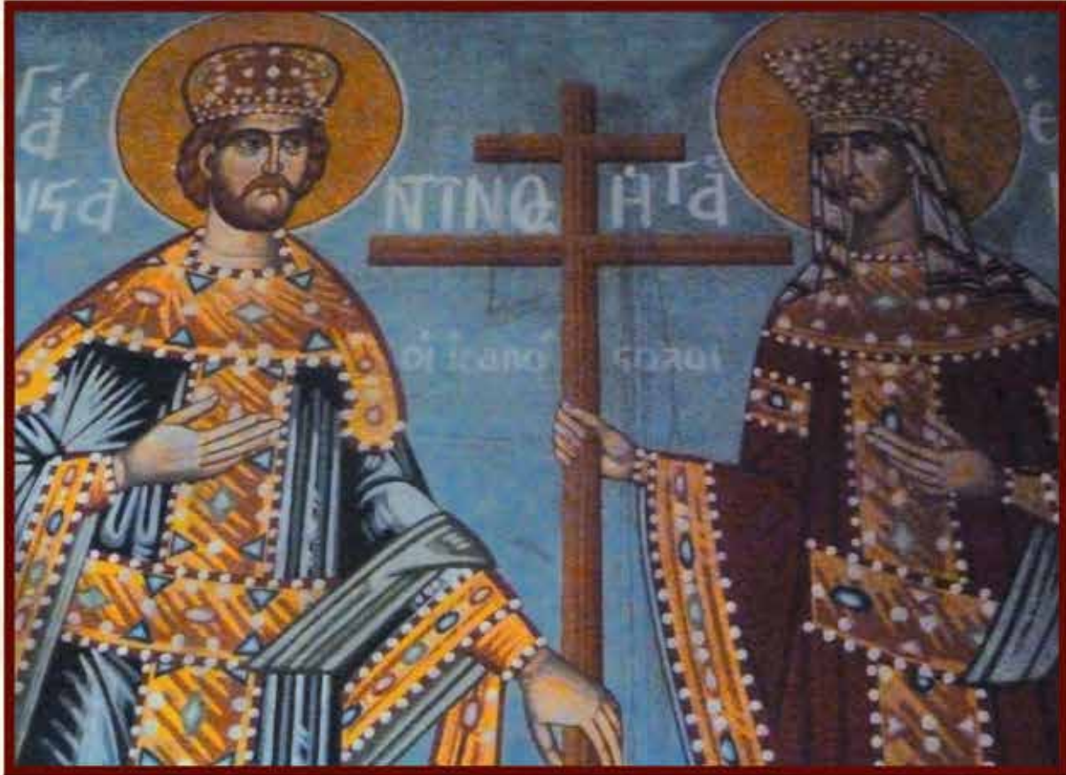
ΙΣΑΠΟΣΤΟΛΟΙ ΚΩΝΣΤΑΝΤΙΝΟΣ ΚΑΙ ΕΛΕΝΗ (Γ. και Ι. Σκοτεινιώτη)