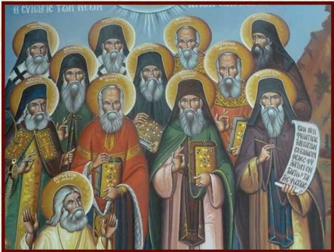
ΣΥΝΑΞΙΣ ΑΓΙΩΝ ΤΩΝ ΝΕΩΝ ΉΑΙΡΩΝ (Κ. Σπανοδήμου)