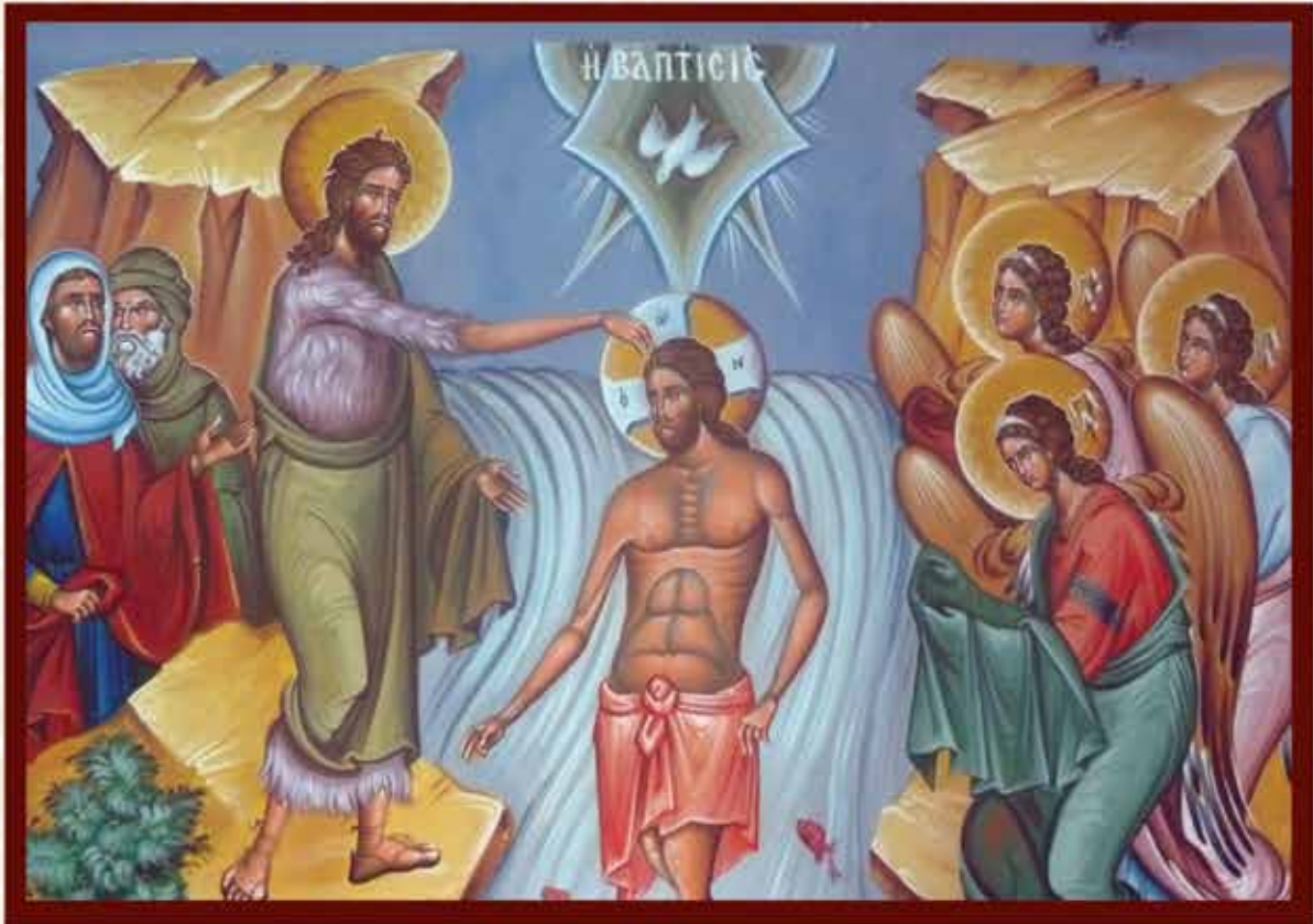
Η ΒΑΠΤΙΣΙΣ (Κ. Σπανοδήμου)