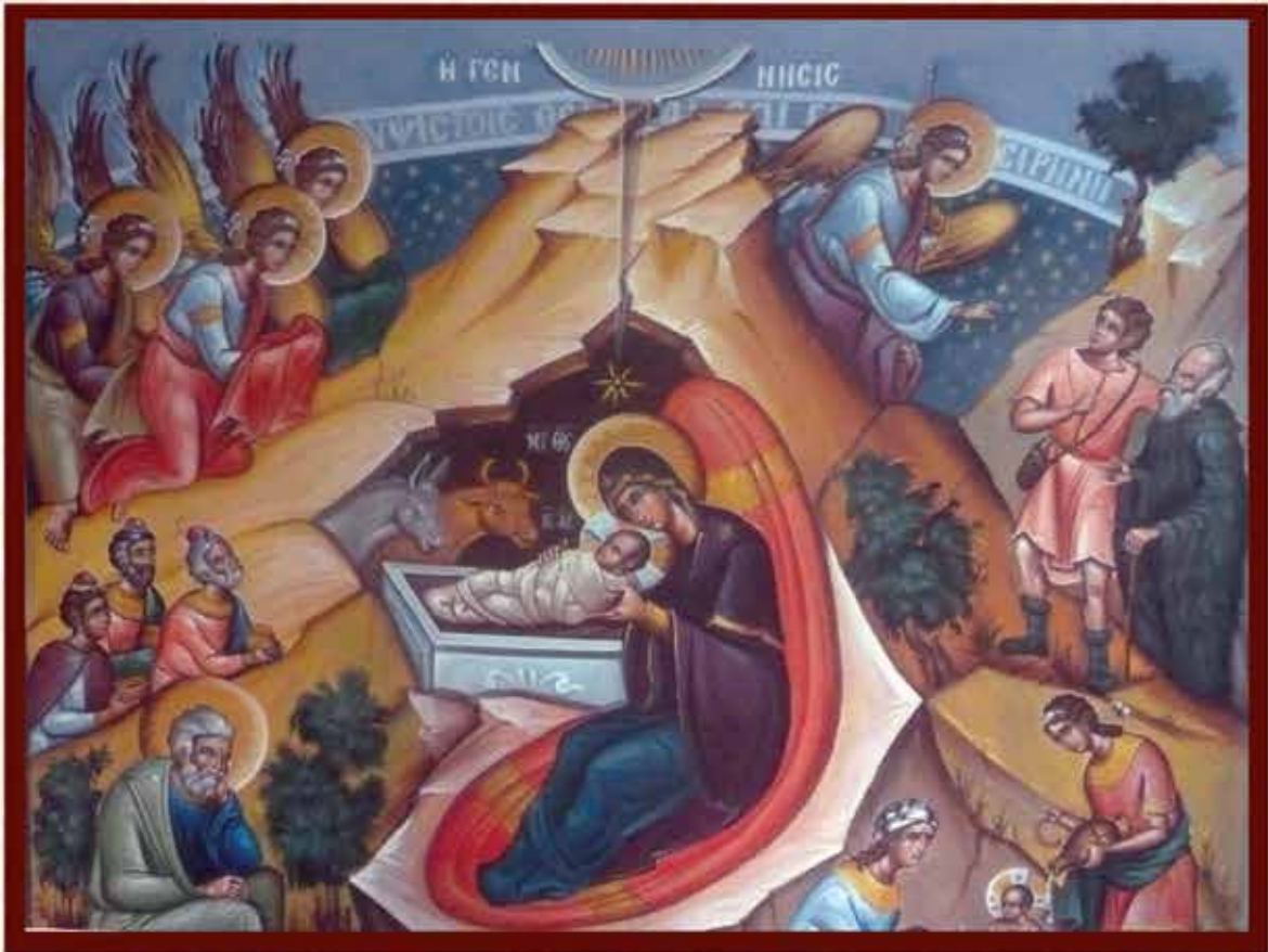
Η ΓΕΝΝΗΣΙΣ (Κ. Σπανοδήμου)