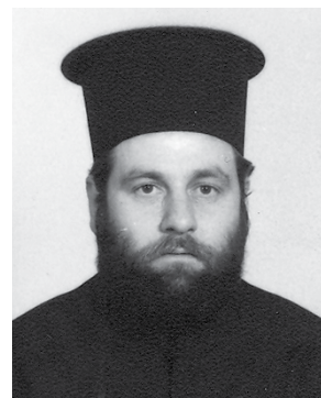
Δημήτριος Καποδιστριας (από το 1996 και εντεύθεν)