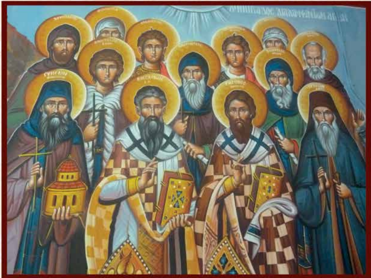
ΣΥΝΑΞΙΣ ΤΩΝ ΕΝ ΜΗΤΡΟΠΟΛΕΙ ΔΗΜΗΤΡΙΑΔΟΣ ΔΙΑΛΑΜΨΑΝΤΩΝ ΑΓΙΩΝ (Κ. Σλανοδήμου)