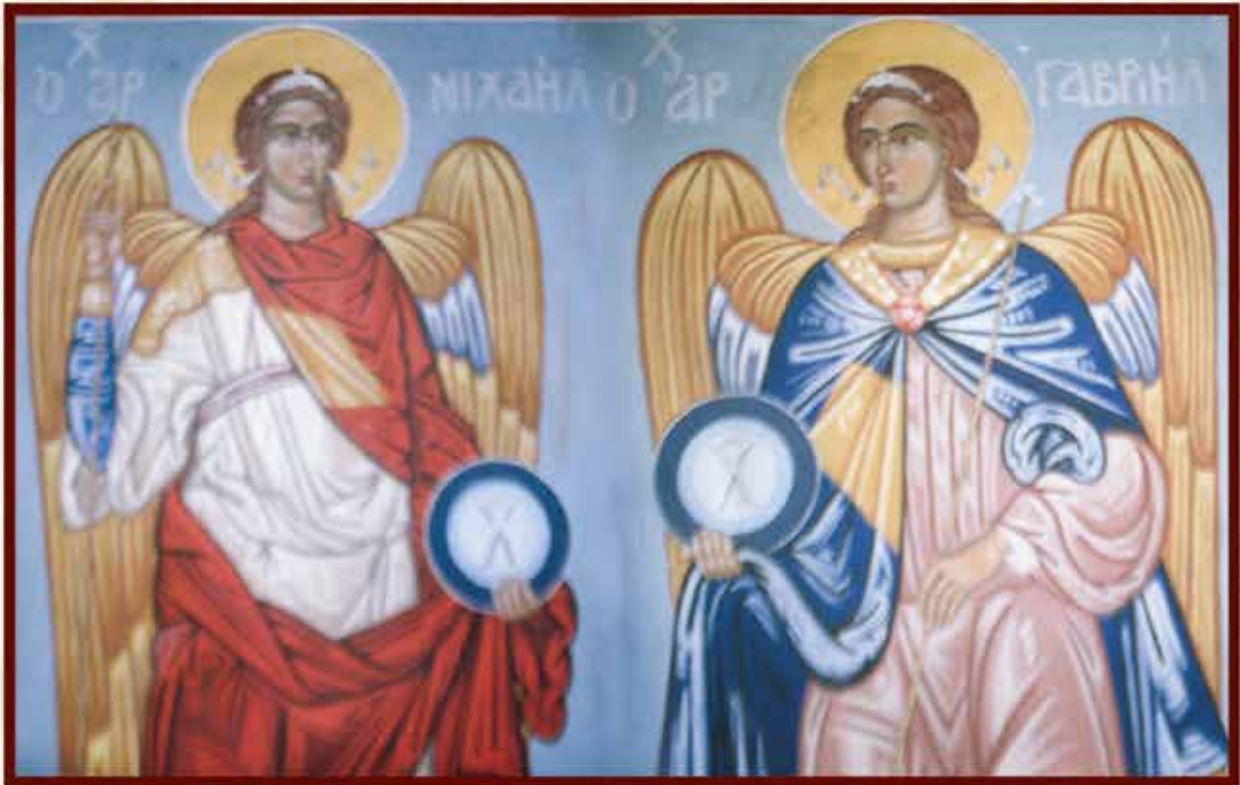
ΤΑΞΙΑΡΧΑΙ ΜΙΧΑΗΛ ΚΑΙ ΓΑΒΡΙΗΛ (Γ. και Ι. Σκοτεινιώτη)