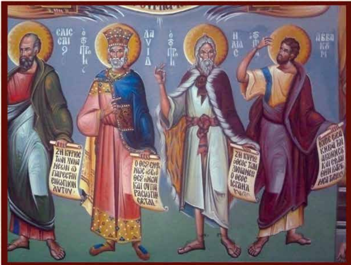
προφηται ΕΙΛΙΣΣΑΙΟΣ, ΔΑΥΙΔ, ΗΛΙΑΣ, ΑΜΒΑΚΟΥΜ (Κ. Σπανοδήμου)