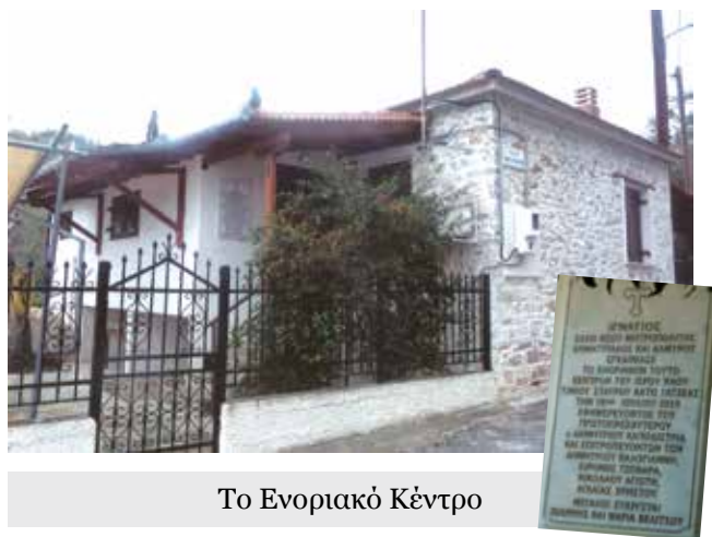
Το Ενοριακό Κέντρο