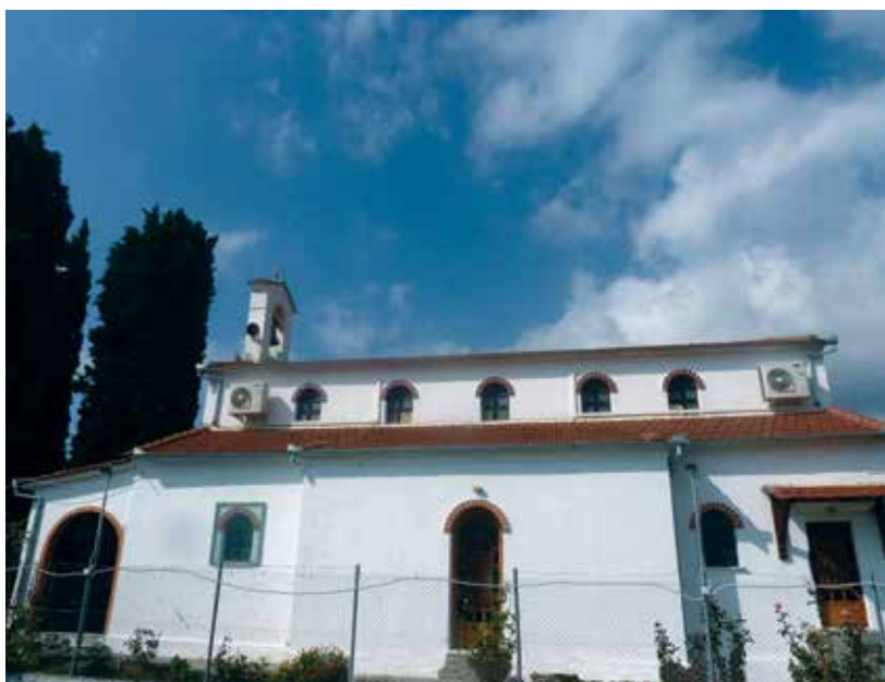
Ο δεύτερος και σημερινός ναός. Αριστερά η πρόσοψη με ανοιχτό παλιότερα τον νάρθηκα. Δεξιά η νότια πλευρά του ναού.