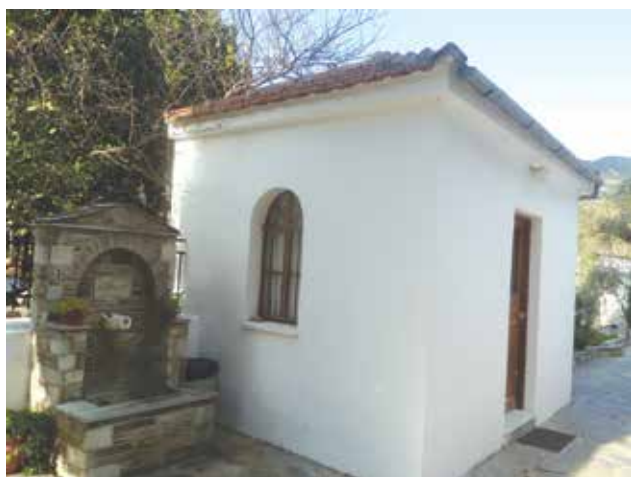
Το γραφείο και η βρύση στον περίβολο του ναού

Ολοκληρώνοντας την αναφορά για τα ιστορικά του Τιμίου Σταυρού να σημειώσω ακόμα πως ο ναός πανηγυρίζει στις 14 Σεπτεμβρίου, γιορτή της Υψώσεως του Τιμίου Σταυρού, και ιδιαίτερα μάλιστα την εσπέρα της παραμονής οπότε τον Μεγάλο Εσπερινό τιμάει κάθε χρόνο με την παρουσία του ο εκάστοτε Μητροπολίτης Δημητριάδος, κα-