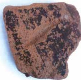
Όστρακο από μελανόμορφο αγγείο που βρέθηκε στο χώρο της παλιάς μονής.

Κι αυτά όσον αφορά στην ύπαρξη της παλιάς μονής, που λογικά και με βάση τα παραπάνω ευρήματα δεν θεωρώ πως μπορεί ν' αμφισβητείται, έστω κι αν δεν υπάρχουν έγκυρα πορίσματα από την αρμόδια αρχαιολογική υπηρεσία, αφού στο συγκεκριμένο χώρο δεν έγινε ποτέ από την ίδια καμιά σχετική έρευνα.