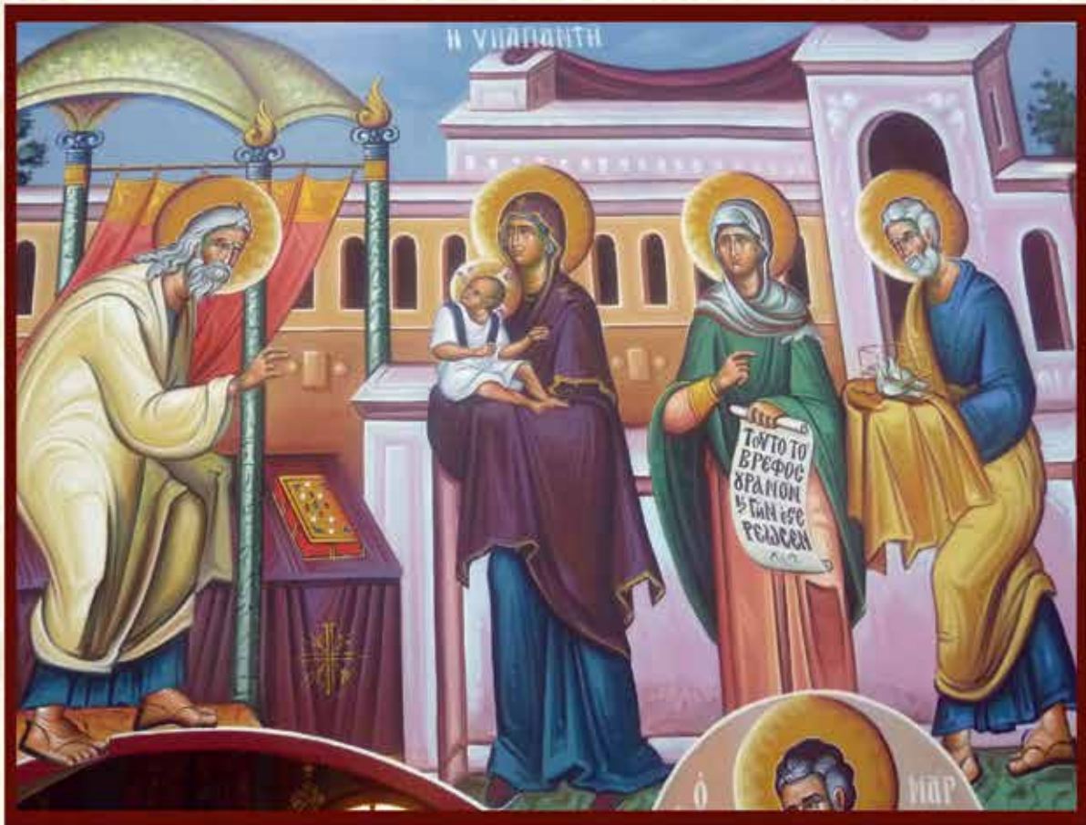
Η ΥΠΑΠΑΝΤΗ (Κ. Στανοδήμου)