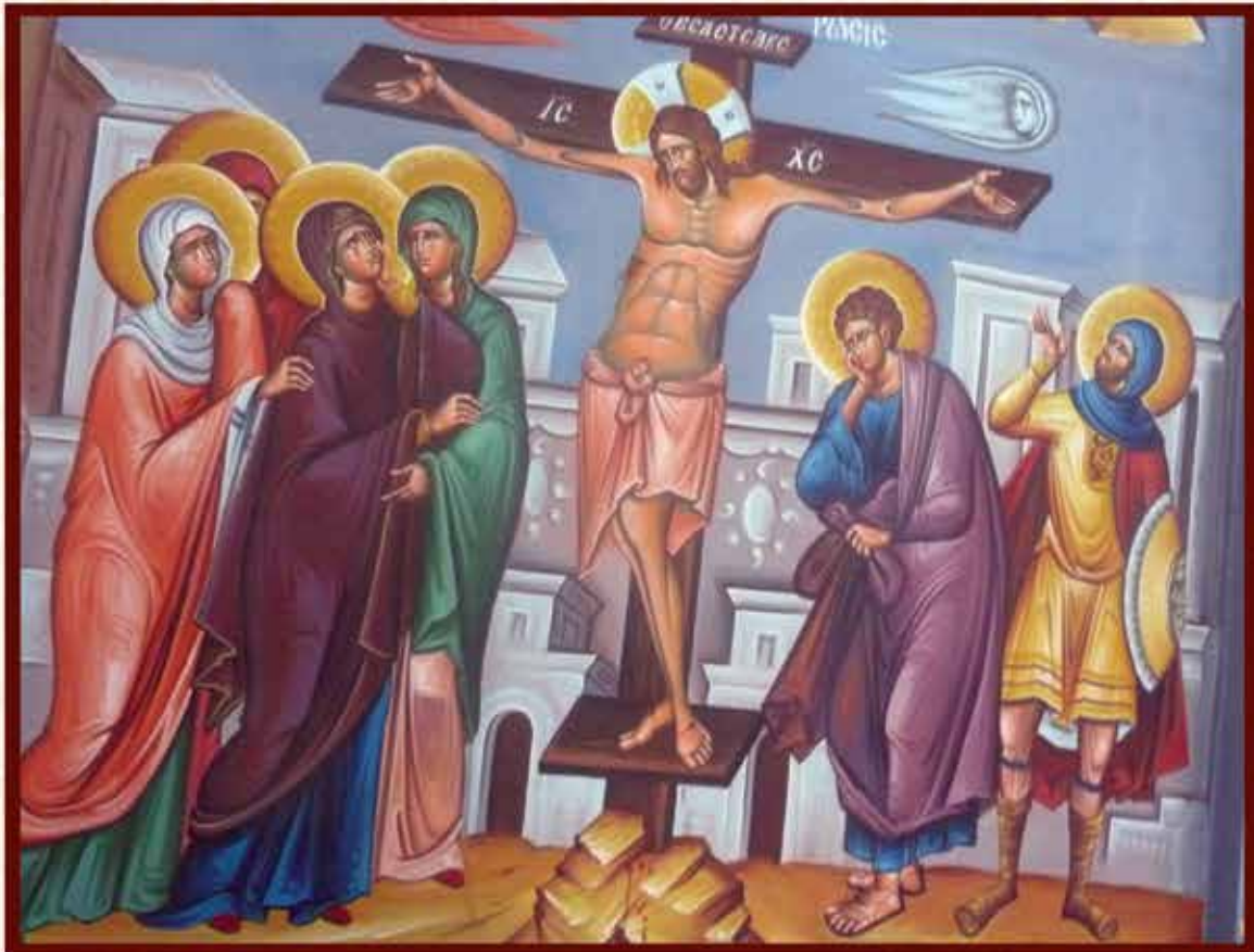
Η ΣΤΑΥΡΩΣΗ (Κ. Σπανοδήμου)