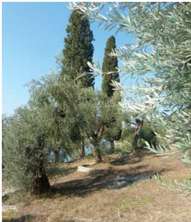
Ο χώρος όπου βρισκόταν η παλιά μονή του Αγίου Ιωάννου.

Δε γνωρίζουμε, λοιπόν, και δεν μπορούμε χωρίς τεκμηριωμένα ιστορικά στοιχεία να προσδιορίσουμε χρονολογικά το ιστορικό παρελθόν αυτών των μνημειακών κτισμάτων. Όπως δεν μπορούμε και να γνωρίζουμε και τις αιτίες του αφανισμού τους. Άγνωστο επομένως αν η μονή που κυρίως μας απασχολεί άκμασε τον 13ο αιώνα, άγνωστο και το πότε κι από ποιους καταστράφηκε – αν έτσι τελείωσε ο βίος της. Κι εδώ έχω τη γνώμη πως ο Παπλόπουλος προσδιόρισε χρονολογικά τον βίο της παλιάς τούτης γατζεώτικης μονής με