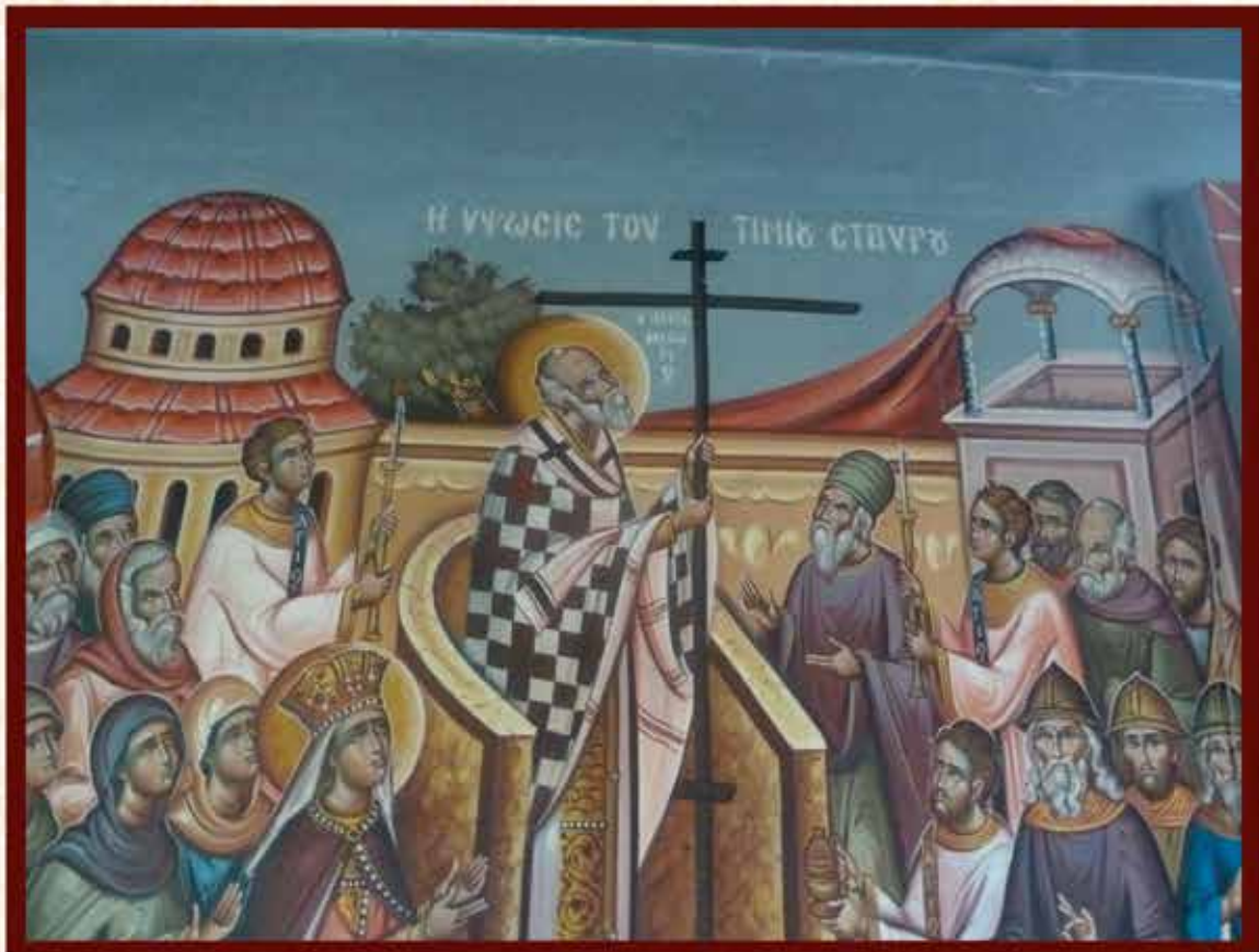
Η ΥΨΩΣΙΣ ΤΟΥ ΤΙΜΙΟΥ ΣΤΑΥΡΟΥ (Κ. Σπανοδήμου)